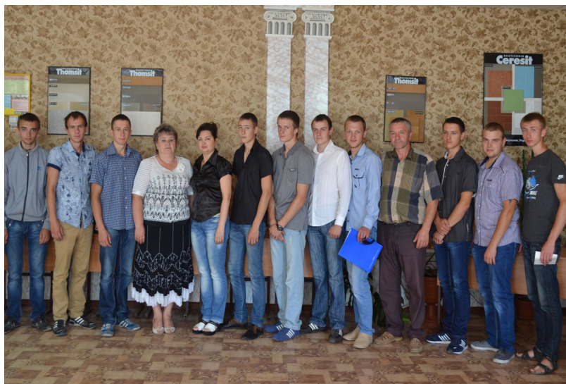
На фото: учні групи БС-5

Беззмарних і благословенних Вам днів, любі викладачі!