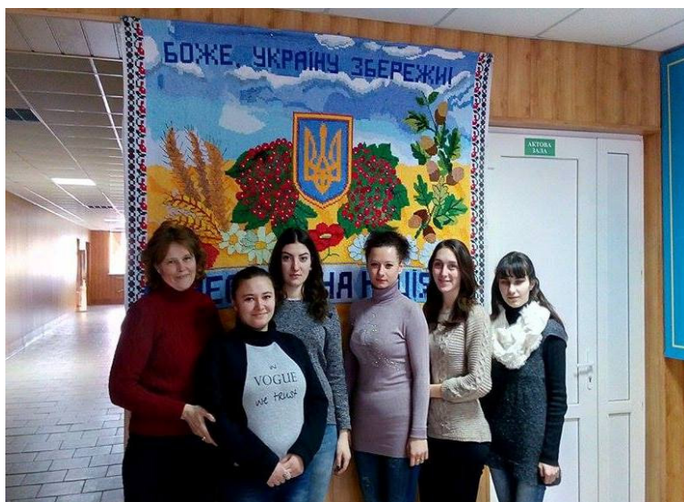
На фото: учні групи ВХП-6

Ми пишаємося тим, що навчалися у стінах цього провідного вищого навчального закладу.