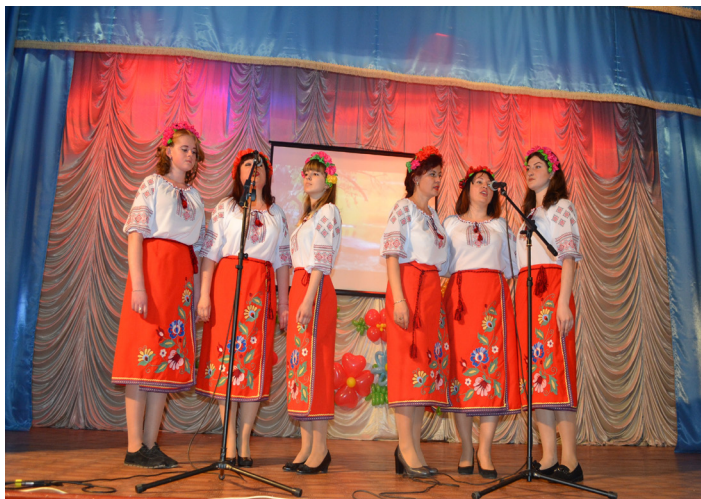
На фото: вокальний ансамбль Роменського ВПУ

Щорічно серед ПТНЗ Сумщини проходить обласний фестиваль художньої самодіяльності, у ході якого учасники демонструють свою творчість, вокальні, хореографічні та декламаторські здібності.