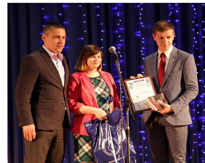
На фото: під час нагородження

Крім того, Дипломи лауреата навчального закладу отримав у таких номінаціях: «Фоторепортаж», «Інтернет газета»,