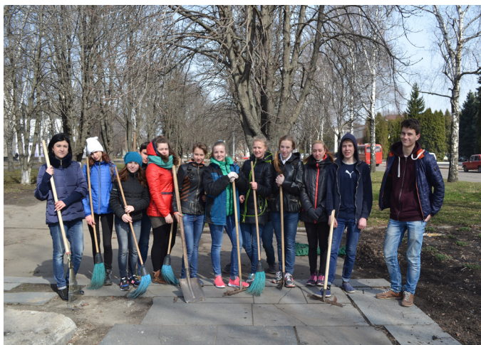
На фото: учні Роменського ВПУ взяли участь у акції «За чисте довкілля»

Весна – це не тільки настання теплої та сонячної погоди, оновлення природи, гарного настрою і самопочуття. Весна – це ще й початок прибирання в будинках, на подвір'ї, в місті.