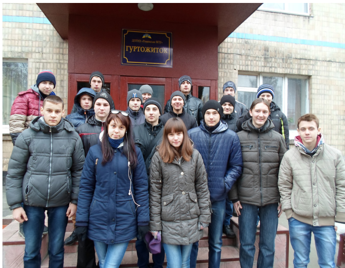
На фото: учні групи МШП-3

Легкокрилим птахом пролітають роки. І ось ми вже закінчуємо навчальний заклад, стоїмо на порозі нового життя, яке відкриває нам стежинки до омріяної професії.