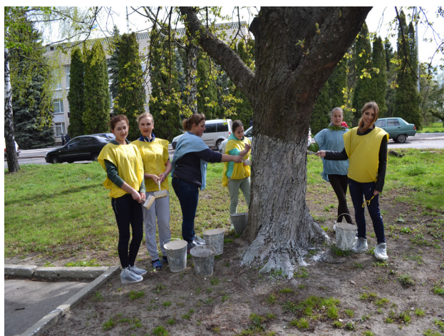
На фото: активісти училища не байдужі до проблем екології