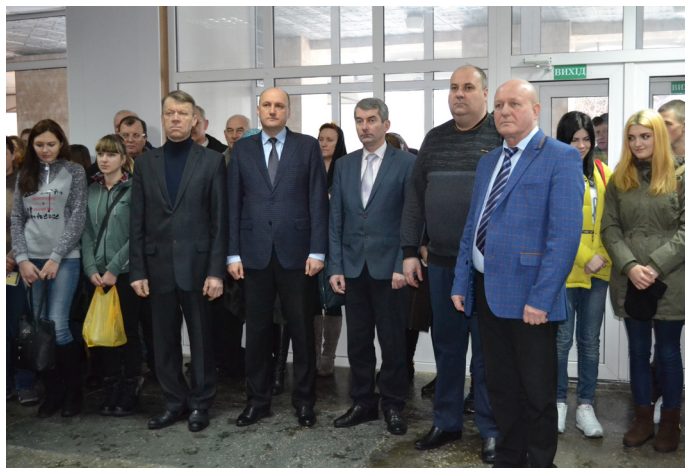
На фото: на свято до училища завітали почесні гості