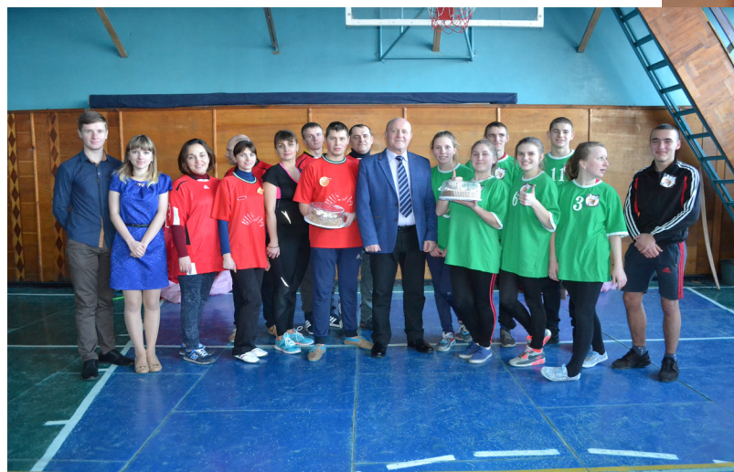
На фото: під час спортивно-розважальної програми «Училище - наша дружня родина»

ГО «Бюро аналізу політики», обговоривши тему «Принципи формування місцевих бюджетів та участь громадськості у даному процесі».