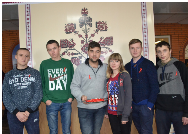
На фото: у ході акції до Всесвітнього дня боротьби зі СНІДом

ського ВПУ з'їхалися активісти з усіх професійно-технічних навчальних закладів Сумської області аби обговорити важливі питання діяльності учнівського самоврядування Сумщини та вкотре наголосити, що співпраця молоді й дорослих дає дієві результати.