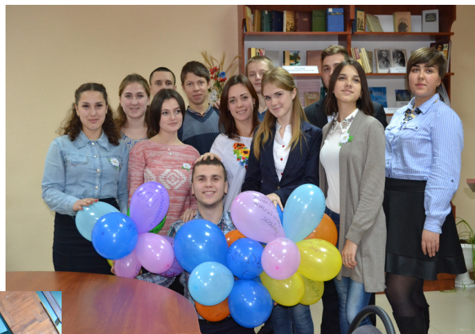
На фото: у ході збору лідерів учнівського самоврядування ПТНЗ Сумщини

За безпосередньої участі окремих членів Учнівської ради ведеться робота по наповненню училищного сайту та відповідних груп в соціальних мережах новинами, готуються до друку номери загальноучилищної газети «Калейдоскоп». Новинкою для нас стало створення блогу Учнівського самоврядування Роменського ВПУ, який можна переглянути за посиланням: http://uchnivskesamovrjaduvanja.blogspot.com/