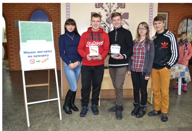
На фото: під час акції «Міняємо цигарку на цукерку»

За участі учнівського самоврядування Роменського ВПУ в училищі проводиться безліч молодіжних заходів, акцій, флеш-мобів. Серед них лише в цьому навчальному році: «Я обираю життя» (до Всесвітнього дня запобігання самогубствам), «Свято Хелловіну», «У пошуках нових зірок», «Будьмо толерантними» (до Міжнародного дня толерантності), «Не дай СНІДу шанс!» (до Всесвітнього дня боротьби зі СНІДом), «Вітальна новорічна листівка». З допомоги лідерів училища було підготовлено цікаву та змістовну спортивно-розважальну програму