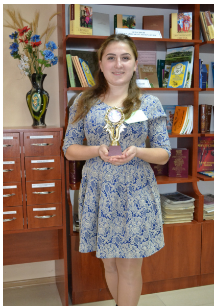
На фото: учениця Роменського ВПУ, Президент обласної ради лідерів учнівського самоврядування ПТНЗ