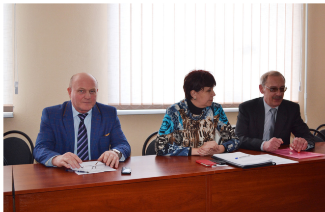
На фото: під час науково-практичного семінару

Учасники семінару також розглянули та обговорили розроблені членами творчої групи проект Методичних рекомендацій з організації вхідного контролю знань, умінь та навичок для осіб, які приймаються до ПТНЗ на відкрите професійне навчання та проект Положення про організацію екстернату у ПТНЗ України.