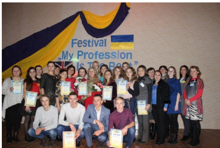
На фото: учасники фестивалю робітничих професій

Учасники фестивалю змагалися в таких конкурсах: «Самопрезентація», «Представлення навчального закладу та професії, за якою навчається учень, з елементами майстер-класу», «Презентація відеоролика уроку з іноземної мови за професійним спрямуванням» та конкурс на кращий лист другові, який живе за кордоном, про Україну, свій навчальний заклад, професію, хобі з елементами hand-made.