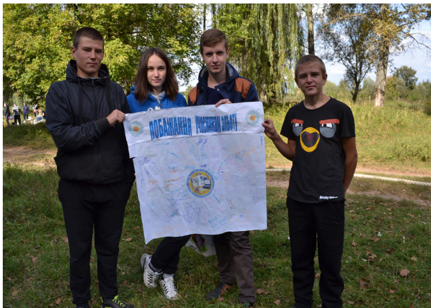
На фото: активісти під час Посвяти в першокурсники

кладу Пучка Володимира та всіляко підтримували його морально.