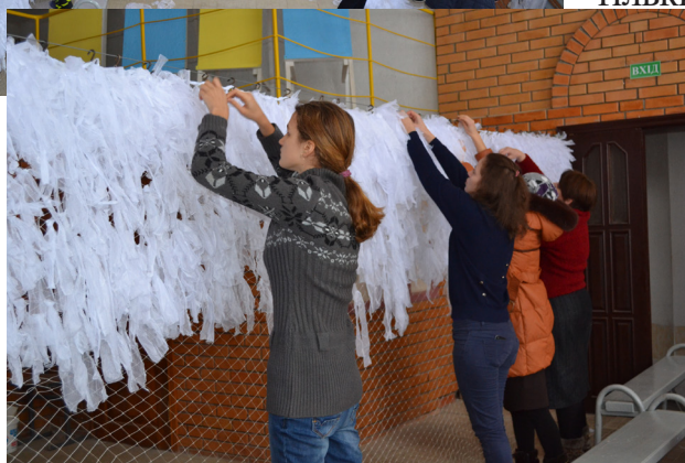
Учнівський та педагогічний колективи Роменського ВПУ під час плетіння маскувальної сітки

Учнівський та педагогічний колективи ДПТНЗ «Роменське ВПУ» продовжують співпрацювати з військовими, які служать в зоні проведення антитерористичної операції на сході країни та по можливості допомагають їм продуктами, теплим одягом, засобами обігріву, речами повсякденного вжитку.